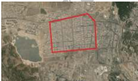
شکل ۲- موقعیت محدوده مورد مطالعه، ماخذ:

شهرک گلستان در شمال شرق منطقه ۲۲ شهرداری تهران واقع شده است و از دو محله گلستان شرقی و غربی تشکیل شده است که در وضعیت کنونی از نظر جمعیتی مشابه هستند اما در افق سال ۱۴۰۰ بخش غربی جمعیت بیشتری را در خود خواهد داد و در مجموع شهرک گلستان حدود ۱۱۰ هزار نفر را در خود جای خواهد داد که درصد از کل جمعیت منطقه ۲۲ را شامل خواهد شد (مهندسین مشاور آرمان شهر ۱۳۹۰).