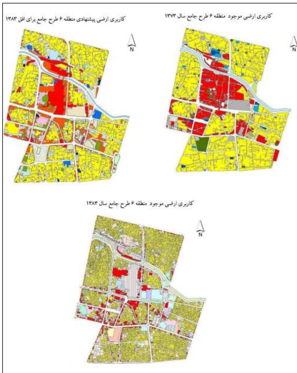
شکل ۲: تحقق‌پذیری کاربری اراضی منطقه ۶ طرح جامع (۱۳۷۳-۱۳۸۳)

مسایل و امکانات خاص گردیده است. در این فضا مؤلفه‌های درون‌زای منطقه شامل توان و قوت‌های نگهبان، نقاط ضعف و کمبودهای بازدارنده توسعه مرکز کلان‌شهری است. نیروهای بیرونی نیز