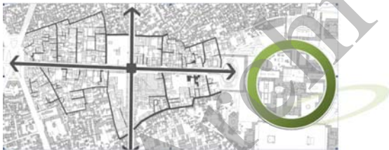
میزان نفوذ پذیری بافت بلافصل خیابان شیرازی

بلوکهای شهری حاشیه محور شیرازی بوسیله معابر عمومی احاطه می گردند دسترسی به داخل این بلوکها بوسیله کوچه های بن بست صورت پذیرفته و این امر موجب سختی حرکت و در نتیجه مشکل شدن دسترسی و عدم دید مناسب به نقاط شاخص درون گردیده بنابراین، بافت پیرامون خیابان شیرازی نسبت به میزان ترددی که در این محور در جریان است، نفوذ پذیری کمی دارد.