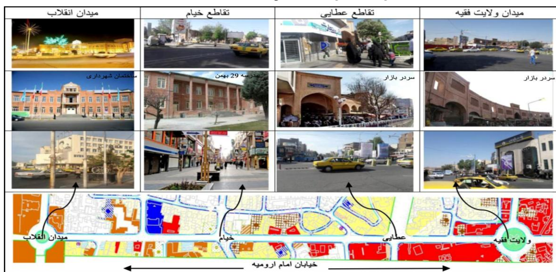
شکل ۳- معرفی قرارگاه‌های رفتاری مورد مطالعه در خیابان امام ارومیه

در تحقیق حاضر ۴ قرارگاه رفتاری میدان ولایت فقیه، تقاطع عطایی، تقاطع خیام و میدان انقلاب در خیابان امام ارومیه (جداره و عناصر مابین دوجداره خیابان) مورد مطالعه قرار گرفته‌اند که کم‌وبیش در هر چهار قرارگاه، آثاری از بناهای دوره‌های صفویه، قاجار، پهلوی اول و دوم و دوره معاصر قابل مشاهده است. قدیمی‌ترین و مهم‌ترین این بناها، بازار تاریخی ارومیه است که مجاور قرارگاه‌های تقاطع عطایی و میدان ولایت فقیه واقع شده، قدمت آن به دوره صفویه می‌رسد. مدرسه ۲۹ بهمن شاخص‌ترین بنای قرارگاه تقاطع خیام است و میدان انقلاب ارومیه با سه ساختمان تاریخی منحصربه‌فرد (موزه، شهرداری و ساختمان ارتش) نقش یک میدان حکومتی را ایفا می‌نماید. (شکل شماره ۳).