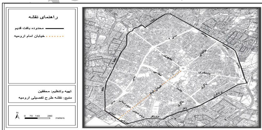
شکل ۲- موقعیت محدوده‌ی مورد مطالعه

شهر ارومیه مرکز استان آذربایجان غربی است که در شمال غرب کشور ایران واقع شده است. خیابان امام در بافت قدیمی و مرکز شهر ارومیه، به عنوان یکی از اصلی‌ترین محورهای ارتباطی، پیونددهنده‌ی بخش‌های مهمی از راه‌های اصلی شهر و بافت قدیم است. کاربری‌های غالب موجود در محدوده‌ی مورد نظر شامل کاربری تجاری، مسکونی، اداری، مذهبی، آموزشی، بهداشتی درمانی و فرهنگی است که کاربری تجاری علاوه بر تمرکز در محدوده‌ی بازار و میدان ولایت‌فقیه، به‌صورت نواری نسبتاً پیوسته و ممتد در حاشیه‌ی خیابان امام و خیابان‌های منتهی به آن کشیده شده است. (شکل شماره ۲).