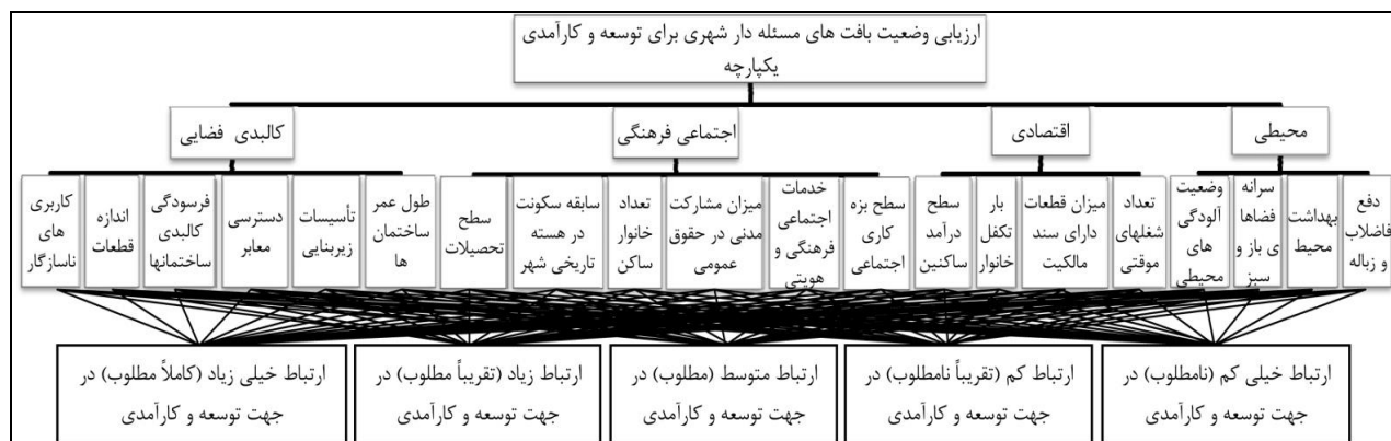
شکل ۳- ساختار سلسله مراتبی پژوهش

مرحله ی دوم: ابتدا ارجحیت شاخص ها به لحاظ وزنی نسبت به یکدیگر با تشکیل ماتریسی محاسبه می گردد. سپس با نرم افزار Matlab ضرایب نهایی با معرفی فرمول ها محاسبه می شود. در فرایند تحلیل سلسله مراتبی فازی محاسبه وزن های نسبی و وزن های نهایی بر اساس شاخص ها در مقایسه با یکدیگر محاسبه می شود.