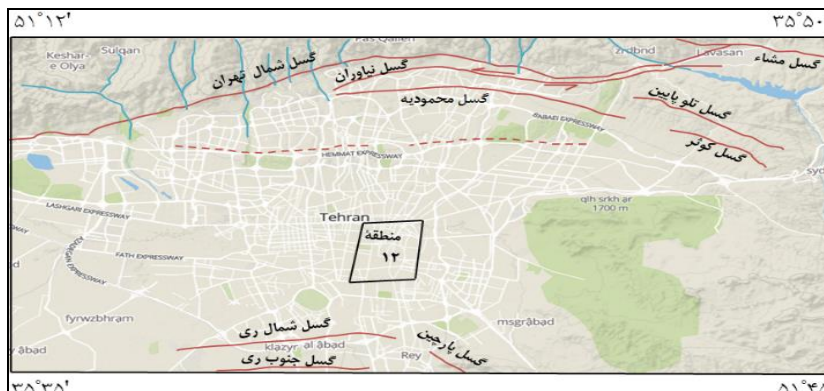
شکل ۲- گسل‌های اصلی تهران که براساس گزارش شماره ۵۶ سازمان زمین‌شناسی کشور (۱۳۷۱) و همچنین گزارش ریتز و همکاران (۲۰۱۲) بر روی نقشه توپوگرافی سه بعدی ۱:۲۰۰۰۰۰۰ بازترسیم شده است.