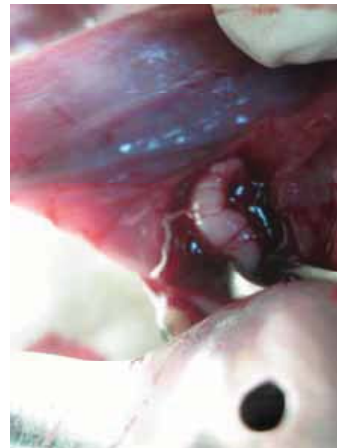
تصویر ۱- تومور غده بزاقی در زیر زبان گربه