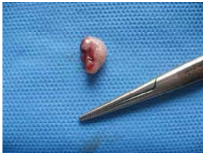
تصویر ۲- نمای ماکروسکوپی غده بزاقی زیر زبانی بعد از عمل جراحی