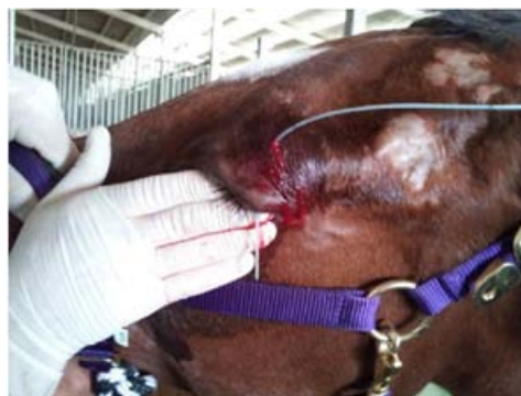
تصویر ۳- کارگذاری شستشوی تحت پلکی در چشم چپ را

وقوع کراتومایکوزیس متعاقب عارضه قرنیه در اسب معمول اما برای بینایی و زیبایی آن پرمخاطره می‌باشد. تشخیص صحیح، مدیریت به هنگام دارویی و در مواردی جراحی،