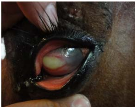
تصویر ۱- کراتیت و پلاک قارچی واضح بر روی قرنیه

با توجه به یافته‌های بالینی و اخذ تاریخچه، کراتومایکوزیس در چشم محرز گردید و به عنوان اولین اقدام درمانی غیر جراحی، شستشوی زیر پلکی نصب و به مدت دو هفته با پویدین - آیودین رقیق روزی دو مرتبه چشم شستشو داده شد