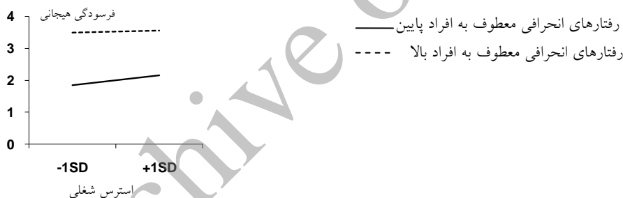
شکل ۳: نمودار رابطه استرس شغلی با فرسودگی هیجانی با رفتارهای انحرافی معطوف به افراد پایین و بالا

چنان که در جدول ۳ مشاهده می‌شود، در بلوک اول که استرس شغلی برای پیش‌بینی فرسودگی هیجانی وارد معادله پیش‌بین شده، توانسته با ضریب بتای استاندارد برابر با 0/42 ، 17/3 درصد واریانس تبیین شده برای پیش‌بینی فرسودگی هیجانی به وجود آورد. در بلوک دوم که رفتارهای انحرافی معطوف به افراد در کنار استرس شغلی برای پیش‌بینی فرسودگی هیجانی اضافه شده، رفتارهای انحرافی معطوف به افراد توانسته با ضریب بتای استاندارد برابر با 0/64 ، 35/7 درصد واریانس افزوده معنادار برای پیش‌بینی فرسودگی هیجانی پدید آورد. در بلوک سوم (اثرات اصلی + تعامل‌ها) پس از افزوده شدن رابطه تعاملی رفتارهای انحرافی معطوف به افراد و استرس شغلی، این تعامل با ضرایب بتای استاندارد برابر با 0/11 - توانسته حدود ۱ درصد ( 0/9 درصد) واریانس افزوده تبیین شده معنادار برای پیش‌بینی فرسودگی هیجانی پدید آورد. این تعامل معنادار به این معنی است که در سطوح بالا و پایین رفتارهای انحرافی معطوف به افراد رابطه احساس استرس شغلی با فرسودگی هیجانی متفاوت است. در نمودار ۳ تحلیل ساده شیب خط (رابطه استرس شغلی با فرسودگی هیجانی) در رفتارهای انحرافی معطوف به افراد بالا و پایین را مشاهده می‌کنید.