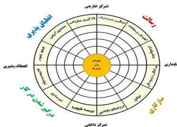
شکل ۱- مدل فرهنگ سازمانی دنیسون

دنیسون مدتی بیش از ۲۰ سال در جهت یافتن شیوه‌ای برای اندازه‌گیری رفتارها و اعتقادات مرتبط با عملکرد کاری، کار و پژوهش انجام داده است و مدل پیمایشی وی به جای آن که بر روی جو عاطفی و کلی محل کار تمرکز پیدا کند، به مفروضات، ارزش و اعتقاداتی تکیه دارد که به‌طور مستقیم بر عملکرد سازمانی تاثیر می‌گذارد. در هر مرحله برای روا نمودن مقیاس و مدل خود، آنها را در جهان واقعی مورد آزمایش قرار داده است. موارد پرسشنامه وی آن‌گونه خاص و ریز شده است که یک نمره کم در یک مورد بیان‌کننده انجام یک عمل نادرست در سازمان است (Monavarian et al. 2008). همان‌طور که در شکل زیر مشاهده می‌شود، این مدل دارای چهار ویژگی اصلی فرهنگ سازمانی یعنی درگیر کردن، سازگاری، یکپارچگی و مأموریت است.