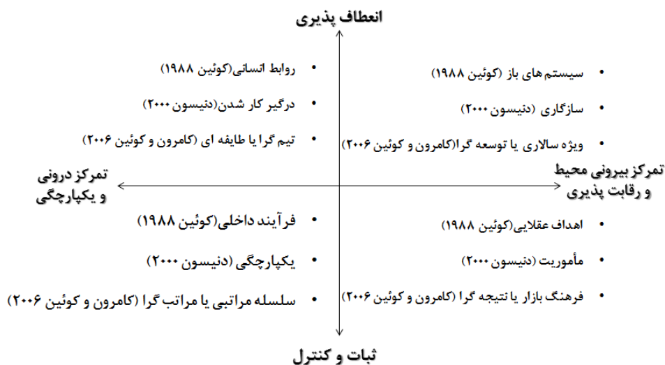
شکل ۳- تطبیق مدل دنيسون با کوئین و کامرون در چارچوب ارزش‌های رقابتی

به این ترتیب مطالعات تطبیقی مدل‌های مبتنی بر ارزش‌های رقابتی می‌تواند پژوهش‌های فرهنگی را به خلق مدل‌های جدید سوق داده و با یکپارچه‌سازی آنها می‌توان به میزان بیشتری به سمت مفروضات جهان شمول دست یافت.