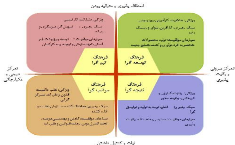
شکل ۲- مدل فرهنگ سازمانی کوئین و کامرون (۲۰۰۶)

آنها پیشنهاد کردند که چارچوب ارزش‌های رقابتی می‌توانند به منظور بررسی ساختار عمیق فرهنگ سازمانی، باورهای اساسی، انگیزه‌ها، رهبری، تصمیم‌گیری، اثربخشی، ارزش‌ها و سایر موارد سازمان به کار رود (Koocheki Siyah Khaleh Sar et al, 2011). مدل فرهنگ سازمانی کوئین و کامرون در شکل ۲ مشاهده می‌گردد.