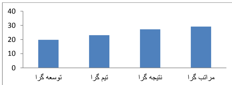
نمودار ۱- نمودار ستونی میانگین انواع فرهنگ‌سازمانی از نظر معلمان در وضعیت موجود

همان‌طور که در جدول ۱ مشاهده می‌شود، در وضعیت موجود فرهنگ مراتب‌گرا بیشترین و فرهنگ توسعه‌گرا کمترین میانگین را دارد. لذا فرهنگ غالب در آموزش و پرورش در وضعیت موجود مراتب‌گرا است.