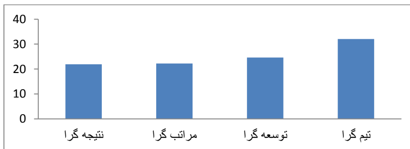
نمودار ۲- نمودار ستونی میانگین انواع فرهنگ سازمانی از نظر معلمان در وضعیت مطلوب

سوال ۲: آیا بین دیدگاه معلمان در مورد فرهنگ کلی با توجه به پست‌های سازمانی دبیر، مدیر و کارشناس اداره تفاوتی وجود دارد؟ برای بررسی تفاوت معناداری دیدگاه معلمان در پست‌های سازمانی دبیری، مدیریتی و کارشناسی از تحلیل واریانس یک طرفه استفاده شد و نتایج زیر به دست آمد.