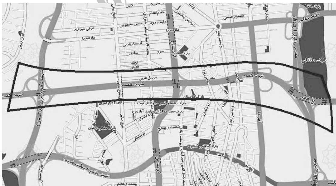
شکل شماره (۲) محدوده مورد مطالعه از بزرگراه شهید همت

بزرگراه شهید همت کوریدور اصلی شرقی-غربی شبکه ترافیکی شهر تهران به طول ۵۶۶۸ متر می‌باشد که از شرق به بزرگراه شهید زین الدین منتهی شده و از غرب در حال توسعه برای اتصال به آزادراه تهران-کرج می‌باشد. این بزرگراه شامل ۱۱ تقاطع غیرهمسطح، ۱۴ رمپ ورودی و ۱۱ لوپ ورودی و ۱۷ رمپ خروجی و ۱۴ لوپ خروجی در شبکه بزرگراهی شهر تهران می‌باشد و در مسیر ۵ منطقه ۲، ۳، ۴، ۵ و ۲۲ قرار دارد، تصویر شماتیک محدوده مورد بررسی در شکل شماره (۲) نشان داده شده است.