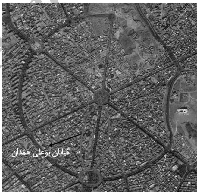
شکل ۱: موقعیت خیابان بوعلی در شهر همدان

محدوده مورد مطالعه خیابان بوعلی است که در بخش مرکزی شهر همدان و بافت قدیم آن واقع شده است (شکل ۱). کارل فریش طراح ساختار شعاعی اولیه این شهر است. این ساختار متشکل است از میدان مرکزی امام خمینی و شش خیابان شعاعی منشعب از آن که یکی از این خیابان‌ها، خیابان بوعلی پایین است که از میدان امام شروع شده و در انتها به میدان بوعلی ختم می‌گردد (خیابان بوعلی بالا نیز از میدان بوعلی شروع شده به سمت میدان جهاد ادامه دارد و البته مقصود این پژوهش خیابان بوعلی پایین است). طول این خیابان حدود ۷۰۰ متر و عرض آن به طور متوسط ۳۰ متر است. این خیابان یکی از خیابان‌های اصلی و پرتردد تجاری، خدماتی و درمانی شهر همدان است. وجود ساختار شعاعی موجود در هسته مرکزی شهر بار ترافیکی زیادی را بر این محدوده تحمیل کرده و تردد پیاده را با مشکلات زیادی مواجه گردانیده است. البته در سال‌های اخیر اقداماتی جهت پیاده‌راه‌سازی این محور توسط مسئولان شهری مانند احداث آب‌نمای طولی در مرکز خیابان، عدم اجازه تردد خودرو در ساعاتی از شبانه‌روز و یا محدود نمودن عبور خودروها به‌جز تاکسی و اقداماتی از این قبیل صورت گرفته است؛ ولی متأسفانه این محور هنوز تا تبدیل شدن به یک محور پیاده کامل فاصله بسیاری دارد.