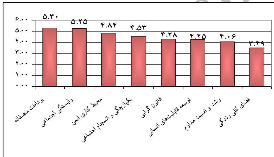
نمودار 1: نتایج میانگین رتبه آزمون فریدمن برای رتبه بندی مولفه‌های کیفیت زندگی کاری

رتبه بندی مولفه‌های کیفیت زندگی کاری و عملکرد کارکنان از طریق آزمون فریدمن لازم به توضیح است که در تمامی آزمون‌های فریدمن ذیل میانگین رتبه بیشتر، نشان دهنده رتبه برتر می‌باشد.