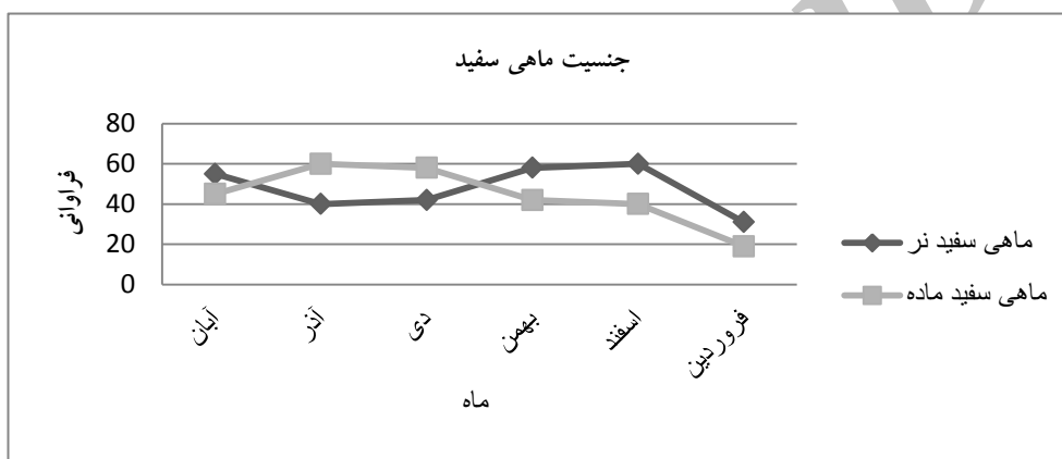
نمودار ۱- جنسیت ماهی در حوضه جنوب غربی دریای خزر (۱۳۹۲-۱۳۹۳).

کلاسه وزنی ۸۴۰-۶۴۰ گرم بوده که فراوانی آن حدود ۳۰/۵ درصد از صید ماهی سفید را شامل می‌شود. حداکثر فراوانی کلاسه وزنی ماهی نر و ماده به ترتیب برابر ۸۴۰-۶۴۰ با فراوانی ۳۵/۷ درصد و ۱۰۴۰-۸۴۰ با فراوانی ۲۸/۸ درصد می‌باشند. با توجه به آمار ارائه شده تنوع وزنی و انحراف معیار ماهیان ماده بیشتر از ماهیان نر می‌باشد. با توجه به نتایج بدست آمده، مشاهده می‌گردد نسبت ماهی نر به ماده دارای نوساناتی می‌باشد اما با نزدیک شدن به زمان تخم‌ریزی نسبت نر به ماده افزایش می‌یابد.