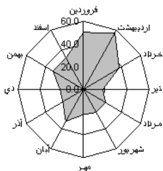
شکل ۲. نمودار غنکبوتی بارش

استخرهای این چشمه آب گرم به رودخانه سلین چای وارد می‌شود که از طریق این رودخانه به دریاچه ارسباران مرتبط می‌گردد.