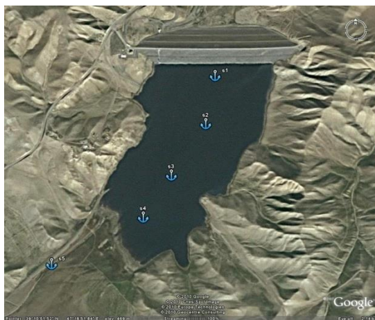
شکل شماره ۱. دریاچه ارسباران (اقتباس از googleearth.com) و محل ایستگاه‌های نمونه‌برداری