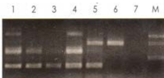
شکل ۲: نتایج PCR چند نمونه مثبت و منفی در کیت IQ2000

۴۴۰ بوده باشد می توان به وجود ایریدو ویروس اطمینان یافت و در حالتی که نتایج در محدوده باندی ۶۶۵ bp