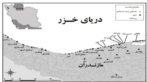
شکل ۱: محل ایستگاه‌های نمونه برداری (پره‌های صیادی) در سواحل شرقی حوزه جنوبی دریای خزر (سال ۱۳۹۱)

سپس در محفظه داغ (هیتر دایجست) در دمای ۹۰ درجه سانتی گراد به مدت ۳ ساعت عمل هضم انجام گردید. پس از خنک شدن، نمونه‌ها با آب مقطر دوبار تقطیر و کاغذ صافی نمونه‌ها صاف شده و به حجم نهایی ۵۰ میلی لیتر رسانده شدند