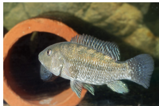
شکل ۱: سیچلاید ایرانی ( Iranocichla hormuzensis )

سیچلاید ماهیان از رده ماهیان استخوانی بوده (Prosanta, 2004) و بالغ بر ۱۰۰۰ گونه می‌باشند (Eschmeyer, 1997). در آب‌های شیرین آفریقا، چهار گونه در خاورمیانه (اردن)، سه گونه در جنوب هند و سریلانکا، هفده گونه در ماداگاسکار، چهارده گونه در کوبا، نود و پنج گونه در شمال آمریکا و تنگه مرکزی آن، دویست و نود گونه در جنوب آمریکا (FAO, 2012) و همچنین در ایران (Coad, 1982; Kullander, 1998) زیست می‌نمایند. از این تعداد نزدیک به ۱۰۰ گونه قابلیت تکثیر و پرورش در شرایط اسارت را دارا می‌باشند (عبدلی، ۱۳۷۸). گونه ویژه ایران با نام سیچلاید ایرانی ( Iranocichla hormuzensis ) یا سیچلاید هرمز (Coad, 2003) (شکل ۱) به عنوان یک گونه بومی، نادر و در معرض خطر انقراض و تقریباً ناشناخته می‌باشد که در فهرست گونه‌های در معرض خطر انقراض IUCN ثبت گردیده است که از قابلیت یاد شده برخوردار بوده و برای اولین بار در سال ۱۹۸۲ گزارش شده است (Coad, 1982).