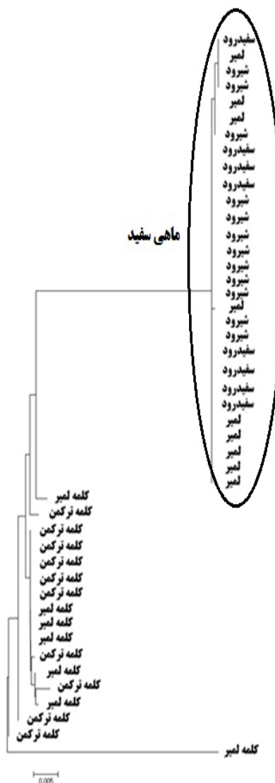
شکل ۲: درخت فیلوژنی ژن سیتو کروم b بین دو گونه ماهی سفید و ماهی کلمه به روش Neighbor-Joining

هاپلوتایپ‌های به دست آمده از نمونه‌های دو گونه و عدم اشتراک آنها با یکدیگر می‌تواند به این دلیل باشد که گونه ماهی سفید مهاجرت تولید مثلی خود به این رودخانه‌ها را زودتر از گونه ماهی کلمه که از اواخر اسفند الی اواسط اردیبهشت شروع می‌شود، انجام می‌دهد (Derzhavin, 1934). بطور کلی در دهه‌های گذشته سیاست‌های بازسازی ذخایر ماهی سفید در