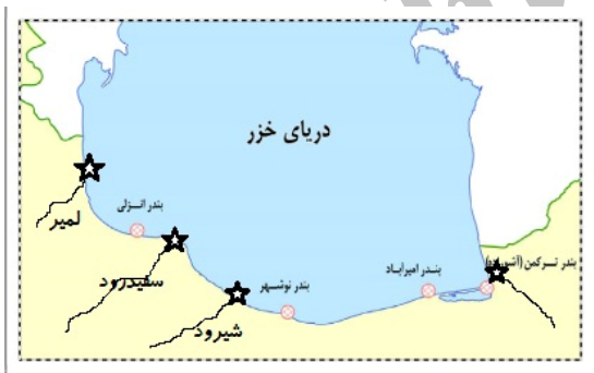
شکل ۱: رودخانه‌های نمونه‌برداری از ماهی کلمه و ماهی سفید

طی سال‌های ۱۳۹۱ و ۱۳۹۲ نمونه‌های ماهی کلمه از رودخانه لمیر در قسمت جنوب غربی و بندر ترکمن در قسمت جنوب شرقی دریای خزر (جمعا ۱۷ نمونه) و ماهی سفید از رودخانه‌های لمیر، سفیدرود و شیرود (جمعا ۲۹ نمونه) در سواحل جنوبی دریای خزر (شکل ۱) توسط صیادان محلی صید و مقداری از قسمت نرم باله دمی آن‌ها بریده و پس از قرار دادن داخل تیوپ ۱/۵ میلی لیتری حاوی الکل ۹۶ درجه به آزمایشگاه ژنتیک پژوهشکده آبی‌پروری آب‌های داخلی بندر انزلی منتقل و قبل از شروع آزمایشات مولکولی به منظور عدم حذف احتمالی الکل داخل ویال و چروکیدگی بافت باله ناشی از آن، در فریزر ۲۰- درجه سانتی‌گراد قرار داده شد.