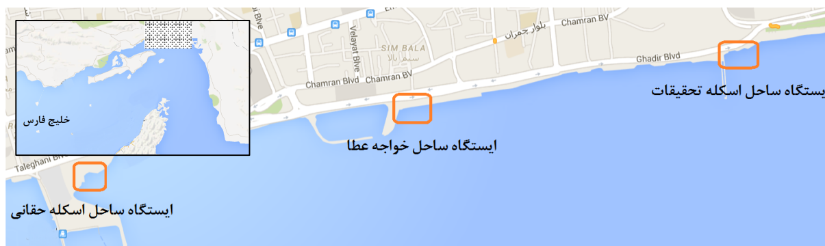
شکل ۱: منطقه نمونه‌برداری کرم پرتار P. nuntia واقع در ساحل شهر بندرعباس، ایستگاه اول: اسکله حقانی، ایستگاه دوم: خواجه عطا، ایستگاه سوم: اسکله تحقیقات.

در سال‌های اخیر ذخایر این گونه با توجه به برداشت بالا، آلودگی و تخریب مناطق ساحلی؛ در جنوب ایران نیز رو به کاهش نهاده است که لزوم توجه جدی به امکان پرورش مصنوعی آن را آشکار می‌سازد. بدون شک یکی از مهمترین ارکان مدیریت گونه‌ها، مطالعه روند تولیدمثلی و تغذیه آنها می‌باشد و بهره‌برداری از ذخایر آبزیان و صید بی‌رویه آنها بدون توجه به زمان بلوغ تولید مثلی و باروری تهدیدی جدی برای ذخایر خواهد بود. تغییرات مرحله بلوغ در طول سال اهمیت زیادی در ساختار علم زیست‌شناسی تولید مثل دارد و به عنوان مثال اطلاعاتی همچون وضعیت هماوری و اندازه اولیه بلوغ و سایر خصوصیات تولید مثلی برای رسیدن به یک برنامه موفق صید و پرورش آبزیان بسیار موثر هستند (Biswas, 1993). هدف از تحقیق حاضر تعیین میزان هماوری کرم پرتار P. nuntia و ارتباط آن با وزن کل گونه، اندازه‌گیری قطر