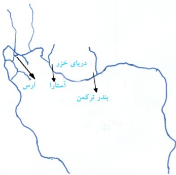
شکل ۱: شکل شماتیک مکان‌های نمونه برداری

نمونه و بندر ترکمن ۱۰ نمونه) توسط صیادان محلی صید (شکل ۱) و کمی از باله دمی آن‌ها توسط قیچی بریده و داخل الکل ۹۶ درجه قرار گرفت و سپس به آزمایشگاه ژنتیک پژوهشکده آبرزی پروری آب‌های داخلی بندر انزلی انتقال یافت.