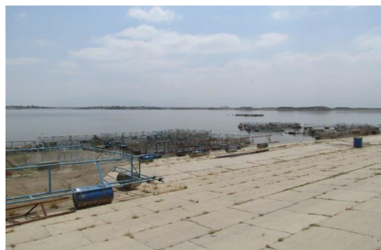
شکل ۲: مرحله ی تکمیل ساخت قفس ها در سد گلستان