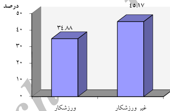
نمودار ۱. مقایسه میانگین احساس تنهایی بین دختران ورزشکار و غیرورزشکار

با توجه به t به دست آمده و سطح معنی‌داری مشاهده شده، فرضیه صفر تحقیق رد می‌شود؛ و این یعنی اینکه بین دختران ورزشکار و غیرورزشکار از نظر احساس تنهایی تفاوت معنی‌داری وجود دارد و دختران غیرورزشکار بیشتر احساس تنهایی می‌کنند. این مفهوم در نمودار ۱ ترسیم شده است.