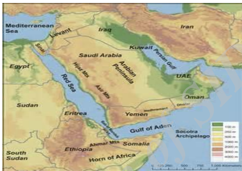
نقشه ۷. موقعیت استراتژیکی تنگه باب‌المنندب برای ایران ۱

معرض مخاطره قرار دهد؛ چراکه بخشی از این سیاست از طریق تسلط بر تنگه راهبردی باب‌المنندب محقق می‌گردد که از اهمیت ویژه‌ای برای ایران برخوردار است (نقشه ۷).