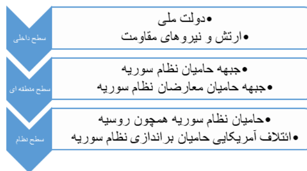
شکل شماره ۲: الگوی سلسله مراتبی بازیگران درگیر در بحران سوریه

از منظر سطح بازیگر، هرچند کنش بازیگران درگیر در این بحران در سطوح مختلفی همچون سطح داخلی (دولت سوریه، ارتش و نیروهای مقاومت، شخصیت‌ها و احزاب سیاسی، معارضین مسلح و ...)، سطح منطقه‌ای (مجموعه اقدامات بازیگران عمده منطقه همچون ایران، عربستان، ترکیه و ...) و نیز سطح نظام (ورود روسیه، ایالات متحده، فرانسه و انگلیس در بحران مذکور) و در دو جبهه کلی موافقان و مخالفان دولت بشار اسد قابل طرح و بررسی است. با این حال، این پژوهش ضمن تأکید بر نقش و تأثیرگذاری دیگر سطوح درگیر در این بحران، تلاش خود را بر نقش بازیگران منطقه‌ای (سطح تحلیل میانی) در روند شکل‌گیری و مدیریت بحران سوریه متمرکز می‌سازد (شکل شماره ۲).