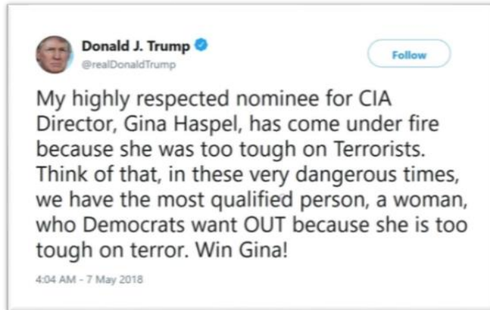
شکل ۳: دفاع سرسختانه ترامپ از هاسپل علیرغم انتقادات فزاینده از او (ترجمه در پاورقی) ۱ :

سوابق بحث انگیز در شکنجه و خشونت، ترامپ با اصرار بر دیدگاه خود از هسپل دفاع کرد.