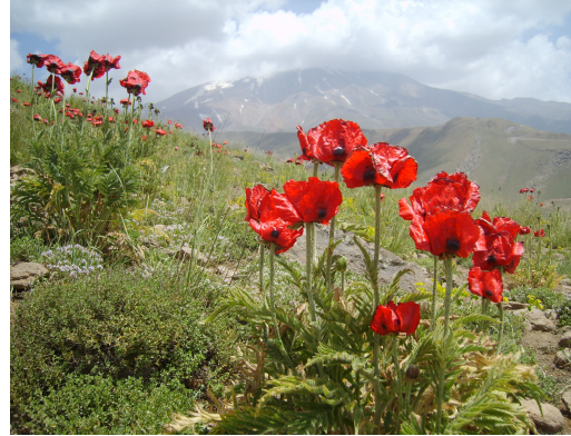
شکل ۱: نمایی از Papaver bracteatum Lindl. در مراتع رینه.