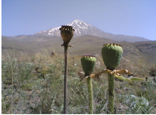
شکل ۲: نمایی از گرزهای P. bracteatum Lindl. در مراتع رینه.