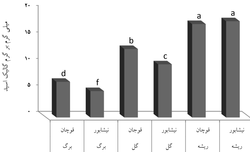
شکل ۱: مقایسه میانگین میزان فنل کل در عصاره باریجه تحت تاثیر اثر متقابل اندام گیاه و رویشگاه

در نتایج بدست آمده در این پژوهش (شکل‌های ۱ تا ۳) عصاره گل باریجه میزان فعالیت آنتی اکسیدانی بیشتری نسبت به سایر اندام‌ها داشتند. بیشترین فعالیت آنتی اکسیدانی مربوط به عصاره متانولی گل باریجه با ۸۴/۵ درصد مهار رادیکال‌های آزاد بود. بیشترین میزان فلاونوئید در عصاره متانولی ریشه باریجه در رویشگاه نیشابور (۱۵/۲۰ میلی گرم بر گرم کوئرستین)، کمترین میزان آن نیز در عصاره برگ‌های