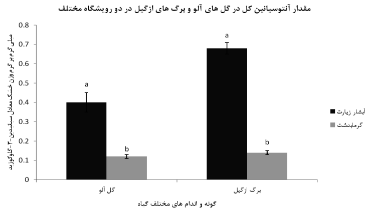
شکل ۳: بررسی مقدار آنتوسیانین کل در گل‌های آلو و برگ‌های ازگیل در دو رویشگاه آبشار زیارت و گرمابودشت؛ (آنالیز آماری تحت ANOVA، حروف غیرمشابه نشان دهنده وجود اختلاف معنی‌دار در سطح ۵٪)

به این مسئله، می‌توان اشعه UV را عاملی موثر در ارتفاعات برای تنش در نظر گرفت و احتمالاً روی مقدار آنتوسیانین کل اثر دارد که می‌تواند افزایش