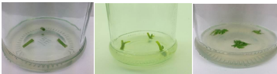
شکل ۱: ریزنمونه‌ها به ترتیب از راست به چپ شامل: برگ، گره با میانگره و میانگره.

استریل چندین مرتبه شستشو شد و در محیط کشت MS و در اتافک رشد با دمای 25 \pm 2 درجه سلسیوس تحت فتوپریود ۱۶/۸ ساعت تاریکی/روشنایی قرار گرفت. پس از گذشت سی و پنج روز که گیاهچه‌ها به حد کافی رشد کردند، از آنها ریز نمونه استریل (برگ، میانگره، گره و میانگره) (شکل ۱) تهیه و برای بهینه سازی محیط کالوس‌زایی در محیط کشت MS به همراه 2,4-D با غلظت‌های ۰ و ۰/۲۵ و ۰/۵ میلی‌گرم در لیتر و هورمون BA با غلظت‌های ۰/۲۵ و ۰/۵ و ۱ میلی‌گرم در لیتر با سه تکرار و در هر تکرار سه ریزنمونه کشت گردید و با توجه به سرعت رشد کالوس‌ها هر ۳-۶ هفته واگشت شدند. آزمایش به صورت فاکتوریل در قالب طرح پایه کاملاً تصادفی با سه فاکتور و سه تکرار بود. (فاکتورها شامل ریز نمونه (برگ، میانگره، گره با میانگره)، سطوح مختلف توفوردی (2,4-D) با غلظت‌های ۰، ۰/۲۵ و ۰/۵ میلی‌گرم در لیتر و بنزیل آدنین (BA) با غلظت‌های ۰/۲۵، ۰/۵ و ۱ میلی‌گرم در لیتر بودند) و پس از گذشت ۳ ماه ارزیابی رشد صورت گرفت. صفات اندازه‌گیری شده شامل طول، عرض، ارتفاع، وزن تر، وزن خشک، رنگ و درصد کالوس‌زایی بوده است. جهت تجزیه و تحلیل داده‌ها از نرم‌افزار SPSS، MSTATC و برای رسم نمودارها از اکسل استفاده گردید و مقایسه میانگین داده‌ها با روش آزمون چند دامنه‌ای دانکن در سطح پنج و یک درصد مقایسه شدند.