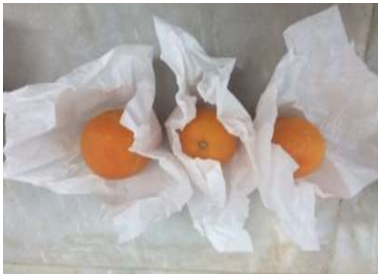
شکل ۱- کاغذ مومی آغشته به اسانس روغنی برای پوشش پرتقال

برای تشخیص تأثیر کاغذ آغشته به اسانس‌های روغنی (زیره سبز، آویشن شیرازی، نعناع) روی صفات حسی میوه ارقام پرتقال محلی جیرفت و والنسیا از ۱۵ نفر ارزیاب آموزش‌دیده استفاده شد. ارزیابی حسی نمونه‌ها، پس از یک ماه نگهداری در سردخانه انجام گرفت. برای این منظور، فرمی تهیه و از گروه ارزیاب خواسته شد تا نمونه‌های مختلف را از لحاظ صفات حسی مورد ارزیابی قرار دهند و میزان رضایت یا عدم رضایت خود را نسبت به هر نمونه با عدد مناسب زیر شماره نمونه، مشخص نمایند. مقیاس اندازه‌گیری بر مبنای ۰-۱۰۰ بود به-طوری‌که عدد صفر معادل غیرقابل قبول، عدد ۵۰ معادل رضایت‌بخش و عدد ۱۰۰ معادل عالی بود (گلشن تفتی و شاه بیک، ۱۳۸۳).