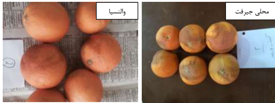
شکل ۲- تأثیر اسانس آویشن شیرازی بر وضعیت ظاهری میوه ارقام پرتقال والنسیا و محلی جیرفت تحت شرایط نگهداری در دمای ۸ درجه سلسیوس و رطوبت نسبی ۹۰-۸۵ درصد