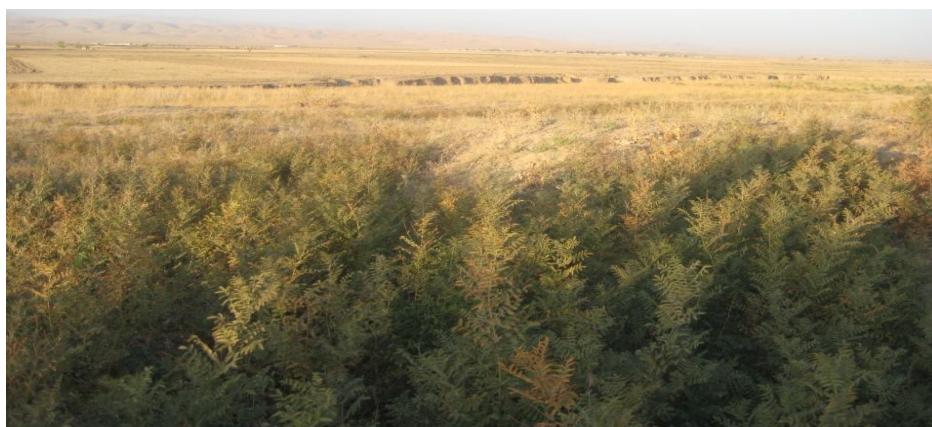
شکل ۱: بوته‌های شیرین بیان در روستای اترآباد (ارتفاع ۱۲۵۲ متر از سطح دریا)