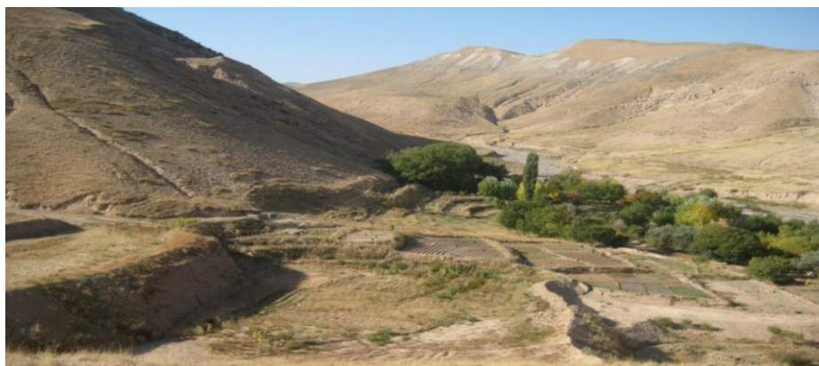
شکل ۲: بوته‌های شیرین بیان در روستای نوروزی (ارتفاع ۱۷۲۲ متر از سطح دریا)