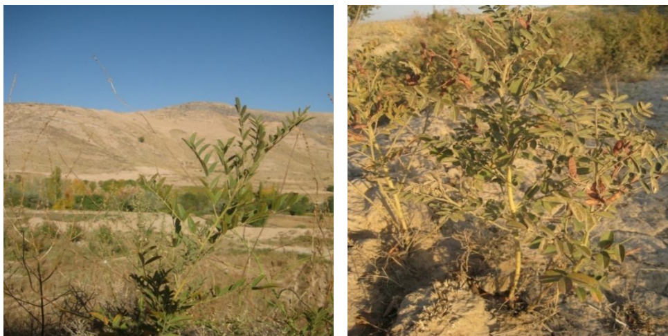
شکل ۳: بوته‌های شیرین بیان در روستای نوروزی (سمت راست) و اتر آباد (سمت چپ)

آلومینیوم کلرید در ۱۰۰ میلی‌لیتر اتانول)، ۰/۱ میلی‌لیتر استات پتاسیم یک مولار و ۲/۸ میلی‌لیتر آب مقطر مخلوط شد. برای تهیه شاهد به جای عصاره متانولی، تنها از متانول خالص استفاده شد. سپس مخلوط در نیم ساعت تاریکی قرار داده شده و سپس جذب آن بلافاصله در طول موج ۴۱۵ نانومتر قرائت شد (Chang et al., 2002). جهت تعیین میزان فلاونوئید کل از منحنی استاندارد استفاده شد. به این منظور غلظت‌های مختلفی از کوئرستین تهیه و بعد از خوانده شدن عدد جذب، منحنی استاندارد رسم شد. از معادله خط بدست آمده از منحنی استاندارد جهت تعیین غلظت فلاونوئید کل استفاده گشت.