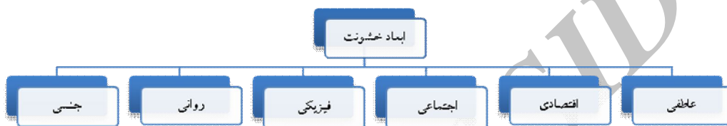
شکل شماره (۲): ابعاد خشونت

روش تحقیق به لحاظ هدف کاربردی پیمایشی می‌باشد. جامعه آماری این پژوهش زنان متأهل شهرستان خلخال می‌باشند. تعداد زنان متأهل براساس آمار امور زنان فرمانداری خلخال ۱۵۰۰۴ نفر می‌باشد که با استفاده از فرمول کوکران ۳۱۸ نفر به عنوان حجم نمونه انتخاب گردید. برای این که تمام جمعیت آماری شانس برابر جهت انتخاب شدن در نمونه داشته باشند از روش نمونه گیری خوشه‌ای به شیوه تصادفی ساده استفاده شده است. بر اساس روش خوشه‌ای تصادفی شهر به چهار منطقه تقسیم شده است و هر منطقه به بیست بلوک تقسیم گردید و از هر بلوک افراد مورد نظر انتخاب گردیدند. ابزار گردآوری اطلاعات پرسشنامه می‌باشد. پایایی پرسشنامه با استفاده از آلفای کرون باخ انجام گرفت که در شاخص های مختلف پایایی بالای ۰/۸۰ گزارش شده است و نشان می‌دهد پرسشنامه از پایایی مناسبی برخوردار است. خشونت به یک شکل و یک شیوه اجرا نمی‌شود. شیوه‌های مختلفی برای خشونت ورزی علیه زنان وجود دارد این مفهوم ابعاد مختلفی دارد با توجه مباحث ارائه شده در بخش نظری و با توجه به پیشینه تحقیقات انجام گرفته، ابعاد زیر برای خشونت در نظر گرفته شده است: