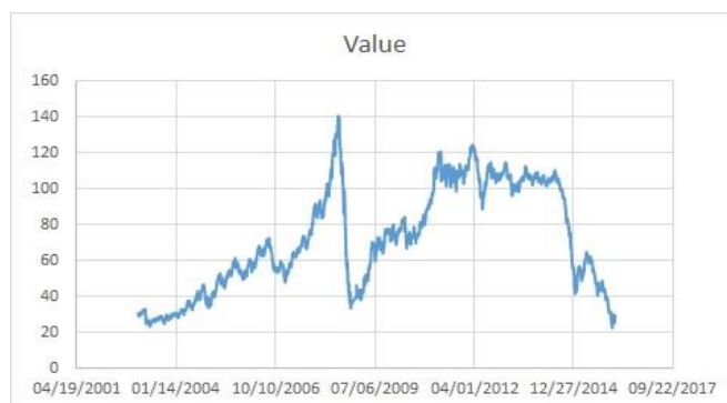
نمودار ۱: قیمت‌های روزانه نفت اوپک در سال‌های ۲۰۰۳ الی ۲۰۱۶

(۱) ابتدای سال ۲۰۰۳ الی انتهای سال ۲۰۰۶ افزایش قیمت نفت به علت حمله آمریکا به عراق