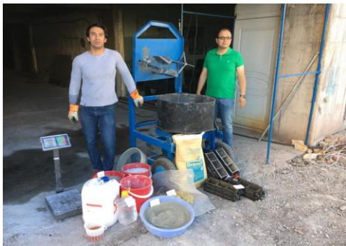
شکل ۴- میکسر مورد استفاده و مصالح مصرفی برای ساخت بتن [۱۲].

نمونه‌های ساخته شده پس از عمل‌آوری مطابق شکل ۸ در دستگاه پرس استاندارد طبق شکل ۹ مورد بارگذاری فشاری قرار می‌گیرند و مقاومت فشاری در سنین مختلف بدست می‌آید.