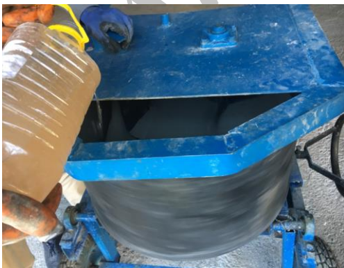
شکل ۵- محلول روان کننده و آب برای ساخت بتن [۱۲].

مراحل اولیه این تحقیق به منظور ساخت بتن UHPFRC در ایران و با مصالح بومی انجام پذیرفته است. بر این اساس، تمامی مصالح مصرفی در بتن به غیر از الیاف فولادی و فوق روان کننده از مصالح بومی ایران تهیه شده است. نسبت‌های مخلوط اولیه بر اساس نسبت‌های مخلوط پیشنهادی گریبل ۱ و اصلاحی جغتایی و پوربابا در ایران در استفاده شده است [۷ و ۸]. در این تحقیق به منظور بررسی رشد مقاومت فشاری نمونه‌ها در سنین ۲ تا ۴۲ روز در بتن با کارایی بسیار بالا، هفت نوع نسبت‌های مخلوط مختلف با درصد‌های وزنی ۰، ۱، ۲، ۳، ۴، ۵ و ۶ درصد از الیاف فولادی استفاده شده است. هر یک از این طرح‌ها به ترتیب به نام نسبت‌های مخلوط سری A تا F نام گذاری شده‌اند که در جدول ۱ نشان داده شده‌اند. برای هر نسبت‌های مخلوط ۱۶ نمونه مکعبی با ابعاد ۱۰×۱۰×۱۰ سانتی‌متر مکعب (جمعا ۱۱۲ نمونه مکعبی) ساخته شده است.