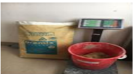
شکل ۳- میکرو الیاف فولادی مصرفی در ساخت UHPFRC