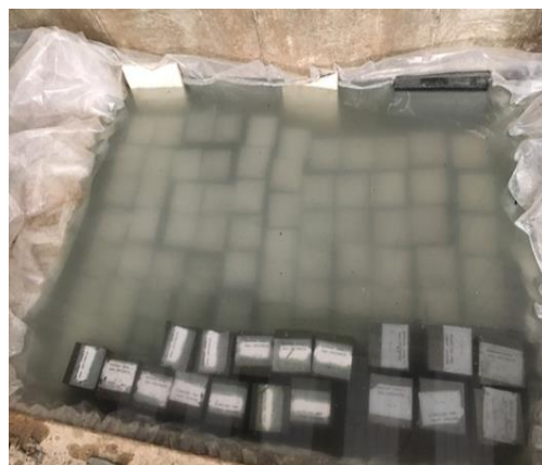
شکل ۸- عمل آوری بتن ساخته شده [۱۲].