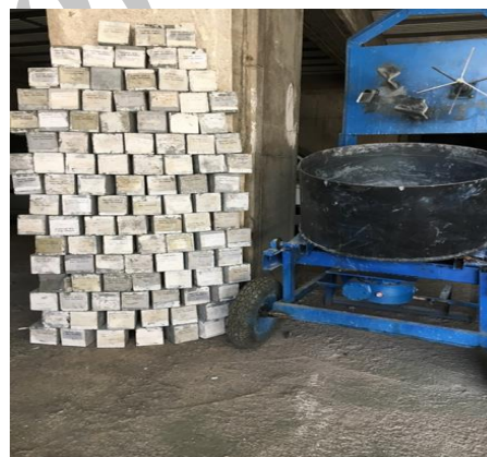
شکل ۱۱- نمونه‌های مکعبی UHPC تست شده مربوط به جدول ۲

۴- با مقایسه مقدار مصرف میکروالیاف صفر و شش درصد همانطور که در شکل ۱۰ نشان داده شده است، نمونه دارای الیاف فولادی بیشتر، حداقل ۲۰ درصد مقاومت فشاری بیشتری در سنین ۲ تا ۴۲ روز از خود نشان می‌دهد که از سن شش روز به بعد با توجه به نحوه رشد مقاومت فشاری ملموس می‌باشد.