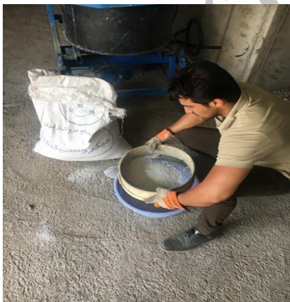
شکل ۱ - الک کردن میکروسیلیس جهت از بین بردن کلوخه های آن

میکروسیلیس به کار رفته در این تحقیق از شرکت فروآلیاژ ایران تهیه شده و دارای بیشینه بعد ۲۲۹ نانومتر میلی متر می باشد این ماده که با نام های سیلیکا فوم ۳ و دوده سیلیس نیز شناخته می شود، محصول فرعی کوره های قوس الکتریکی صنایع فروآلیاژ و فروسیلیس بوده و ماده ای است با فعالیت پوزولانی بسیار شدید که بیش از ۸۵ درصد سیلیس بلوری نشده دارد [۷]. شکل ۱ الک کردن میکروسیلیس به منظور حذف کلوخه های جزئی موجود در آن، قبل از استفاده در ساخت بتن را نشان می دهد. لازم بذکر است که میکروسیلیس در حین دپو و نگهداری با جذب فوری رطوبت محیط بصورت کلوخه ای در می آید و حذف کلوخه های آن باعث ترکیب مناسب آن با دیگر مصالح ریز دانه می گردد که این مشکل با عبور آن از الک حل می گردد.