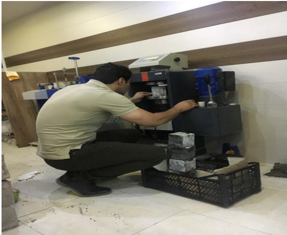
شکل ۹- بارگذاری نمونه‌های ساخته شده [۱۲].