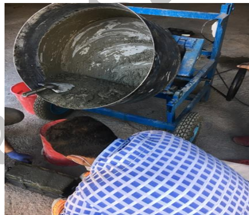
شکل ۷- قرارگیری بتن درون قالبهای استاندارد [۱۲].

جدول ۲- مقاومت فشاری نمونه‌های مکعبی UHPC در آزمایشگاه برحسب کیلوگرم بر سانتی متر مربع.