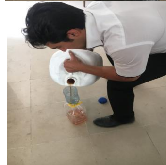
شکل ۲- فوق روان کننده مصرفی برای ساخت بتن توانمند