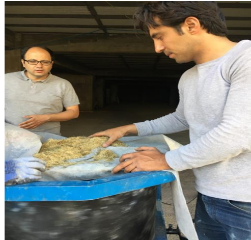
شکل ۶- میکرو الیاف برای ساخت بتن [۱۲]