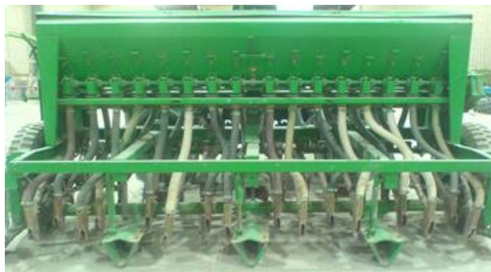
شکل ۲: بذرکار مکانیکی برزگر همدان (خطی کار)