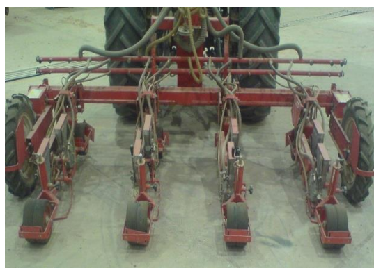
شکل ۱: ریز دانه کار نیوماتیکی گاسپاردو مدل وی ۵ و اجزای واحد کارنده آن شامل: ۱- موزع بذر، ۲- مخزن بذر، ۳- کشک کارنده (شیار باز کن)، ۴- پوشاننده بذر، ۵- چرخ فشار دهنده لاستیکی جلو، ۶- چرخ فشاردهنده لاستیکی عقب، ۷- دستگیره دوار برای تنظیم عمق شیار، ۸- فنر تنظیم فشار شیار باز کن، ۹- کنار ریز کلوخه

نگه می دارد. با رسیدن بذر به بالای لوله سقوط، مکش پشت حفره یا سوراخ قطع شده و بذر در اثر وزن خود و فشار باد پایین می افتد. صفحه موزع بر اساس اندازه بذر ها تعبیه شده است. مکش سیستم باید بگونه ای باشد که بتواند بذر ها را روی این صفحه نگاه داشته و در مقابل لوله سقوط رها کند. صفحه موزع مورد استفاده برای بذر کلزا از صفحه موزع با اندازه حفره ۱/۵ استفاده شد.