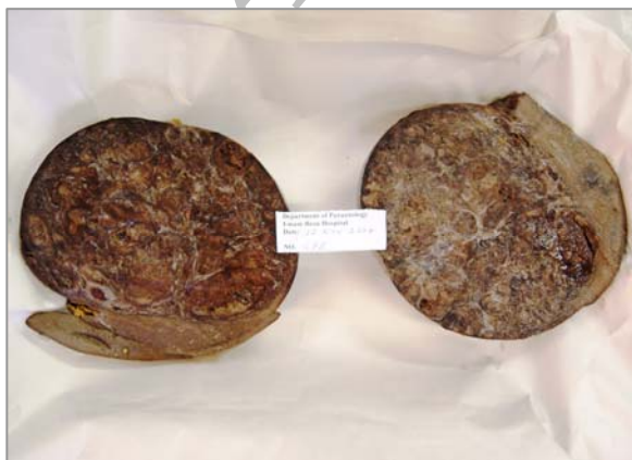
شکل ۱ - نمای ماکروسکوپی کیست هیداتید آلوتولار طحال

در بررسی ماکروسکوپی طحال حجیم به وزن ۳ کیلوگرم به ابعاد ۱۱×۱۷×۲۱ سانتی متر در بیش از ۹۰٪ سطح برش کیستیک با نمای مولتی لوکولار و حدود نامنظم حاوی ماده نکروتیک ژلاتینی قهوه ای رنگ بود، به طوریکه پارانشیم طحالی به صورت غشاء باریکی در اطراف کیست نمایان بود (شکل ۱).