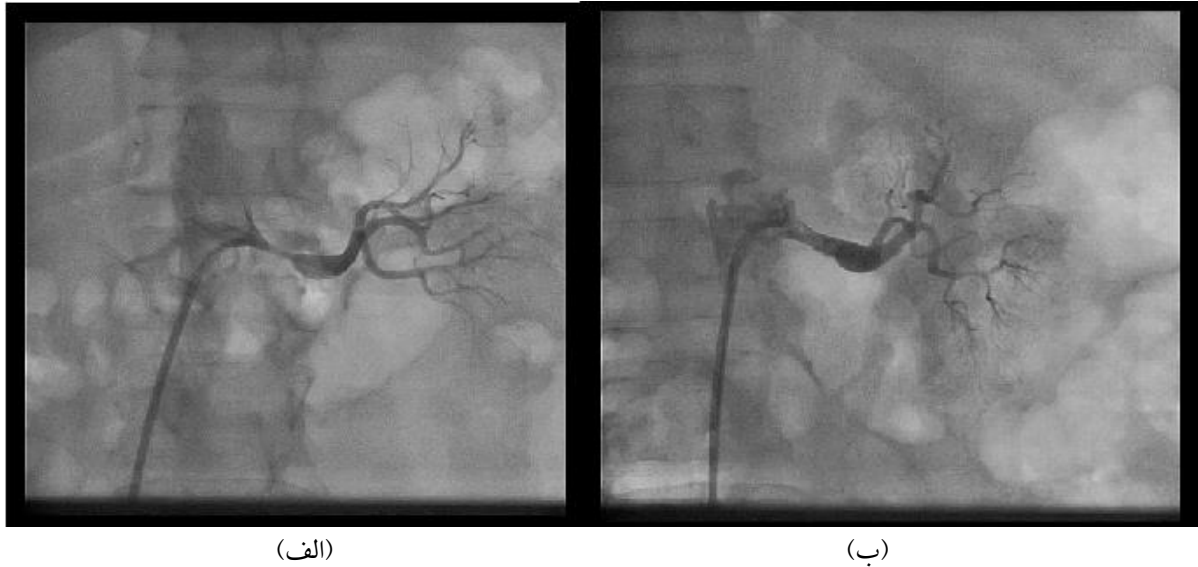
شکل ۳- شریان کلیه چپ در بیمار دوم، (الف): تنگی قابل توجه در قسمت ابتدایی، (ب) برطرف شدن تنگی پس از تعبیه استنت.

همی پارزی و نوار مغز طبیعی با دستور دارویی مرخص می شود. یک سال قبل با شکایت دیس ارتری و فشار خون کنترل نشده در بخش نورولوژی بستری شده که در MRI نمایی شبیه بیماری های دمیلیزان دیده میشود که البته در نهایت با تشخیص بیماری عروقی در زمینه فشارخون کنترل نشده مرخص می شود. آخرین بار با شکایت حملات سرگیجه و عدم تعادل و فشار خون بالا و با تشخیص TIA و رتروبازیلار در ۵ ماه قبل از مراجعه اخیر، در اورژانس اعصاب بستری میشوند. در سی تی اسکن مغز ایشان شواهد درگیری عروق کوچک مغز ۱ مشهود بود که با توصیه به پیگیری درمان فشار خون مرخص می گردند. بیمار تحت بررسی علل پرفشاری خون قرار می گیرد که در سونوگرافی داپلر عروق کلیه تنگی شدید شریان کلیوی چپ گزارش میگردد. سپس جهت ایشان اسکن کاپتوپریل کلیه ها انجام میشود که اندازه هر دو کلیه کاهش یافته بود و عملکرد کلیه راست و چپ به ترتیب در حد ۳۰ و ۷۰٪ بود. کراتینین بیمار در حد ۱/۷ mg/dl و GFR معادل با ۵۵٪ داشت. در اکوکاردیوگرافی هیپرتروفی شدید بطن چپ مشهود بود (ضخامت سپتوم بین بطنی در حد ۲۲ میلی متر). بیمار تحت آنژیوگرافی قرار گرفت که تنگی شدید در حد ٪ در شریان کلیه چپ تایید شد (شکل ۴-الف) و بنا بر این استنت