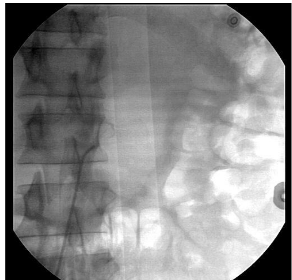
شکل ۱- انسداد کامل دهانه شریان کلیه چپ (بیمار اول)

در سونوگرافی کالرداپلر از شرایین رنال، تنگی شدید شریان در کلیه چپ گزارش شد. این در حالی است که سایز کلیه های دو طرف در حد قابل قبول بود. کراتینین و GFR بیمار به ترتیب در