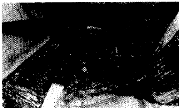
شکل سه - محل کیمبرشن عصب مدیان توسط پسودو آنورسم. تغییر رنگ عصب کاملا واضح است.

نمی تواند از نظر آناتومیک آسیب به عصب میانی دست ( Median ) را توجیه نماید. بیمار کاندید عمل جراحی جهت explore عصب مدیان گردید. با برش ( Volar ) از ناحیه چین قدامی آرنج پوست باز شد و پس از کنار زدن عضله Pronatortrase مشاهده گردید که توده ای با جدار مشخص