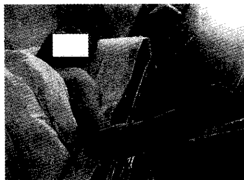
شکل دو - الف . اختلال در آپوزیشن. ب. اختلال در فلکشن انگشتان ۱ و ۲ و ۳

دیاگنوستیک ( Electro diagnostic ) گزارش آسیب متوسط عصب میانی دست ( Median ) شده بود اما در گزارش هم به این نکته اشاره شده بود که محل ورود چاقو و مسیر آن