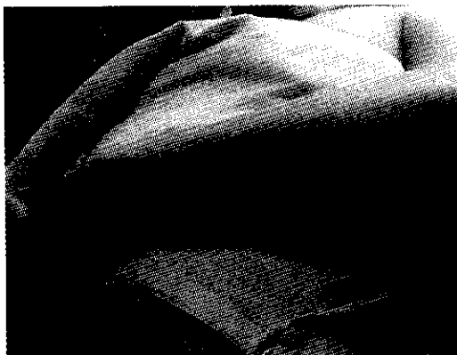
شکل یک - محل ورود چاقو در دورسو اولنار و پروگزیمال ساعد چپ

هفته قبل به دنبال ورود چاقو در حین نزاع به قسمت ابتدائی و پشتی اولنار ساعد چپ شروع شده است ( شکل یک).