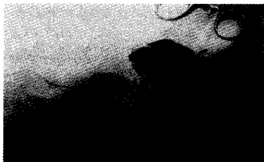
شکل چهار - جدار پسودو آنورسم

شریان explore گردید که دچار پارگی نسبی طولی شده بود (شکل ۵). به دلیل شکننده بودن جدار شریان امکان ترمیم وجود نداشت و شریان بسته ( Ligator ) شد.