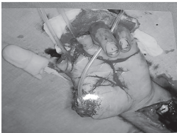
تصویر ۱- مراحل اولیه درمان در این تصویر نمایش داده شده است