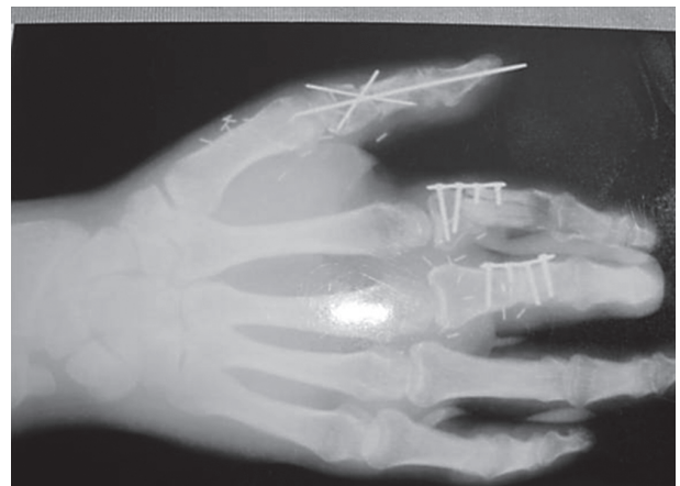
تصویر ۵- رادیوگرافی بیمار پس از درمان