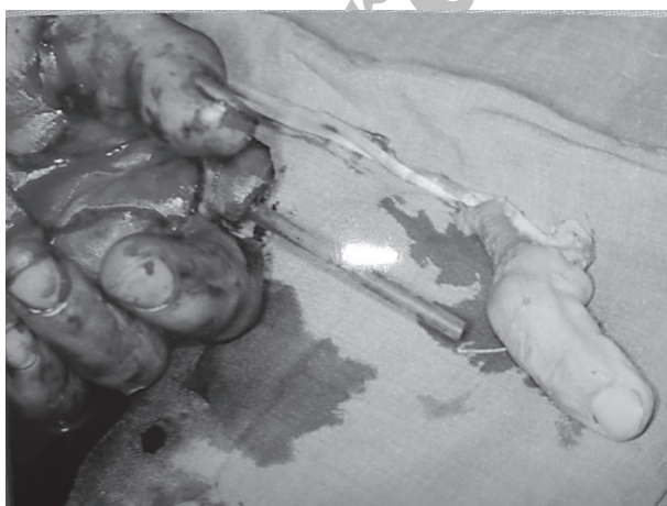
تصویر ۳- پیوند انگشت میانی بعد از انگشت شست در اولویت قرار گرفته است

میکرو واسکولر، پیوند انگشتان قطع شده، قابل انجام گردید. Shigeo Kumatsu و Sosomi Tamae در سال ۱۹۶۵ نخستین کسانی بودند که این عمل را انجام دادند (۲). امروزه روش‌های مدرن پیوند در اغلب بیمارستان‌های بزرگ دنیا در دسترس مردم قرار دارد. در ۴۰ سال اخیر هزاران قسمت از اعضای قطع شده مجدداً به بدن مصدومین پیوند زده شده است و در بسیاری از آنان موجب بهبود کیفیت زندگی و توان عملکردی گردیده است (۴، ۵).