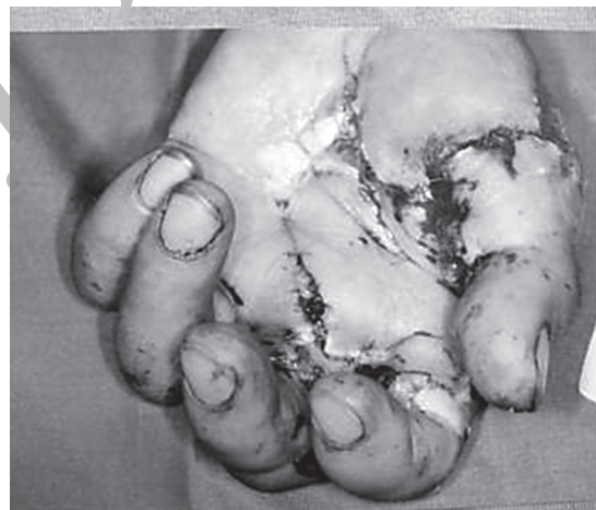
تصویر ۴- نمای دست مصدوم بعد از پیوند انگشت نشانه

یک سال پس از حادثه، مصدوم جهت ارزیابی نهایی و برآورد کارشناسی میزان خسارات به متخصص پزشکی قانونی معرفی گردید. در معاینه بالینی، انگشت شست قادر به حرکات اکستانسیون و فلکسیون فعال نبود ولی حرکات ابدوکسیون و ادوکسیون آن قابل قبول بود. انگشت نشانه در مفاصل بین انگشتی پروگزیمال و دیستال محدودیت شدید حرکتی داشت و انگشت میانی نیز در حالت نیمه خمیده (Semi-flex) ثابت بود و هیچ‌گونه حرکت فعالی نداشت. دامنه حرکات مچ دست طبیعی بود. در بررسی رادیوگرافی‌ها آثار شکستگی با جابجایی در استخوان فالنکس پروگزیمال انگشت شست، خرد شدگی استخوان فالنکس پروگزیمال انگشت نشانه، و شکستگی با جابجایی در استخوان فالنکس پروگزیمال انگشت میانی مشهود