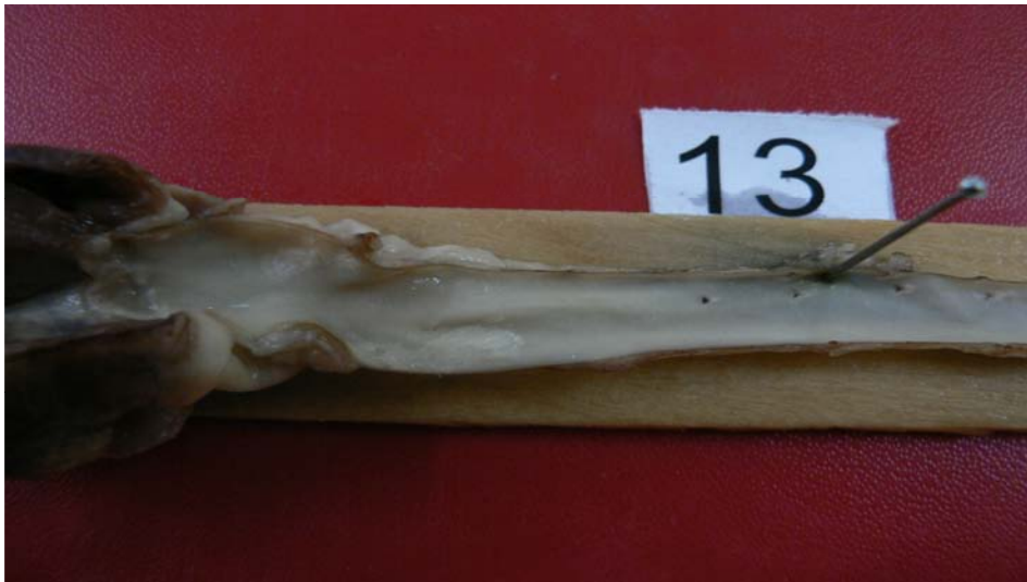
شکل ۱- ضایعات عروقی قوس آئورت و آئورت توراسیک (گروه هیپرکلسترولمیک)