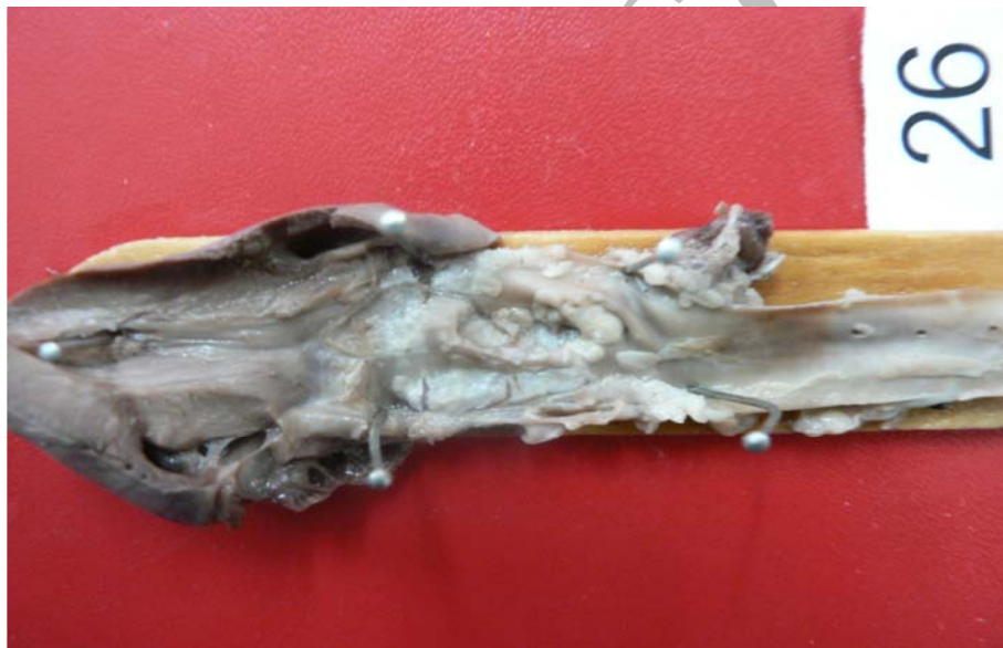
شکل ۲- ضایعات عروقی قوس آئورت و آئورت توراسیک (گروه هیپرکلسترولمیک و معتاد)

در مطالعه ای که توسط Frassdorf و همکاران در رابطه با اثر مورفین روی قلب انجام گرفت، مشاهده شد که مورفین دارای اثرات حفاظتی روی قلب می باشد که البته این اثر از طریق تاثیر روی چربی‌های خون و پیشگیری از آترواسکلروز نبوده، بلکه از طریق گیرنده های اوپیوئیدی Kappa B می باشد [۴].