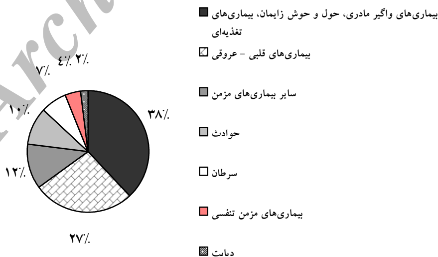
شکل ۱- علل مرگ برای تمام گروه‌های سنی در منطقه EMRO در سال ۱۳۸۴