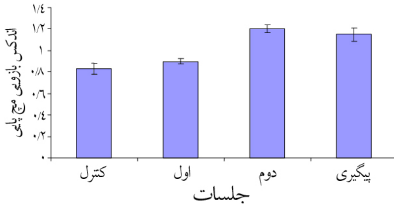
شکل ۱- مقایسه میانگین مقادیر ABI با استفاده از repeated measure ANOVA و LSD test در بیماران دیابتی تحت درمان با IPC در چهار مرحله ارزیابی (جلسات کنترل (۲۲ روز قبل از شروع درمان)، اول (قبل از درمان)، دهم (پس از ۱۰ جلسه درمان یک روز در میان) و پیگیری (یک ماه پس از آخرین جلسه درمان))

بین مقادیر میانگین نمره حاصل از پرسشنامه Valk در جلسات کنترل، اول و دهم و نیز بین جلسات افزایش معنی داری دیده شد ( P=0/000 ) (شکل ۲). با استفاده از تست مونوفیلانمان نیز در مقایسه جلسه اول با دهم تعداد نقاط درک شده توسط بیمار افزایش معنی داری را نشان داد ( P=0/001 ).