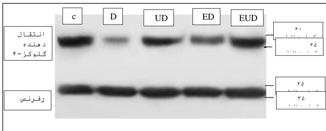
شکل ۱- تصاویر مربوط به باند پروتئین glut4 در گروه‌های مورد مطالعه

شماره‌ی آنتی بادی GLUT-4: ab216661. GAPDH: ab181602