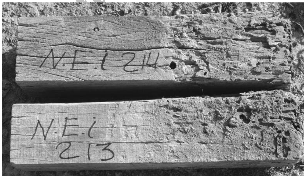
شکل ۴ - آزمایش میدانی نمونه های شاهد چوب E.intertexta