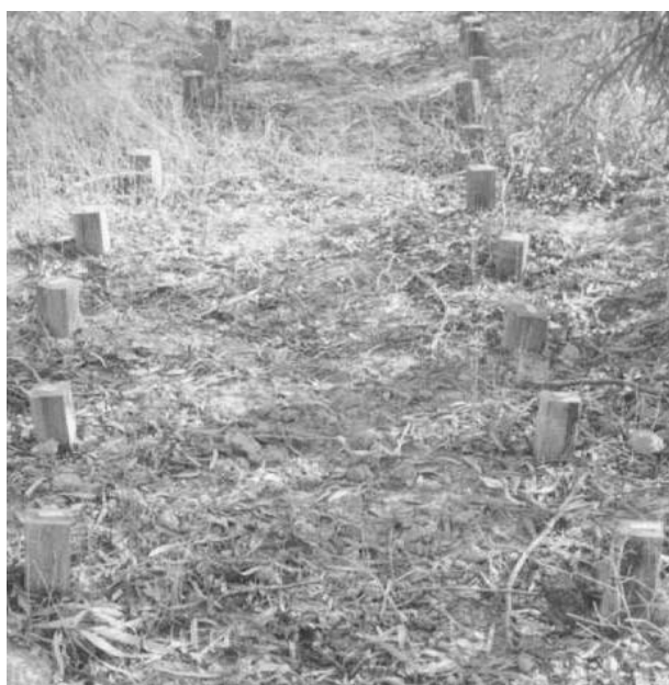
شکل ۲- نصب نمونه‌های چوب در آزمایش میدانی (field test)

جهت اطمینان از حضور موربانه و انتخاب محل آزمایش میدانی، تعداد ۲۰ عدد از نمونه‌های تیمار نشده چوب گونه راش، به عنوان پیش آزمایش نصب شدند، پس از حصول اطمینان از وجود موربانه‌ها، تعداد ۲۰ عدد از نمونه‌های آزمایشی تیمار نشده (دوام طبیعی) چوب درون E.intertexta در خوزستان (ایستگاه الباجی) با آماده سازی زمین نصب شدند. نمونه‌های ۲×۲×۴۷ و ۸×۸×۳۰ سانتیمتر بیش از نصف طول به طور عمودی در خاک و نمونه‌های به ابعاد ۲/۵×۲/۵×۲۵ به طور افقی به عمق ۱۵ سانتیمتر در داخل خاک قرار گرفتند. یک سال بعد، نمونه‌های آزمون اشباع شده با کرئوزت و سلکور در ابعاد ذکر شده با ۳۰ تکرار در ایستگاه الباجی نصب شدند (شکل ۲).