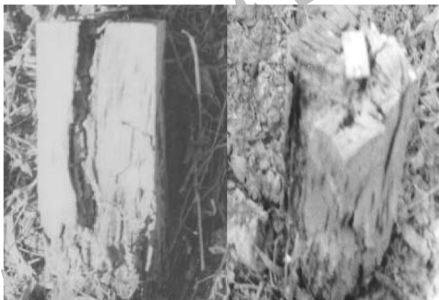
شکل ۳- چوبهای راش نصب شده جهت انتخاب محل آزمایش

نمونه های چوب گونه راش که به عنوان پیش آزمایش جهت انتخاب محل آزمایش میدانی نصب شده بودند، در سال اول مورد حمله شدید مورپانه‌ها قرار گرفته و پس از ۳ سال آن قسمت از نمونه‌ها که در داخل خاک قرار