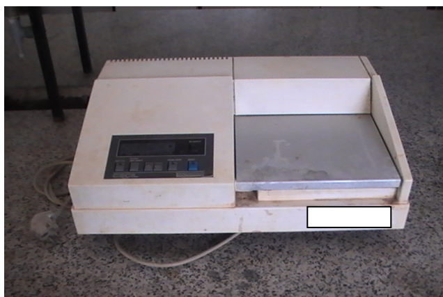
شکل ۱ ضمیمه - دستگاه اسپکتروفوتومتر سری ۱۰۰۰ مدل CEIL EE1020