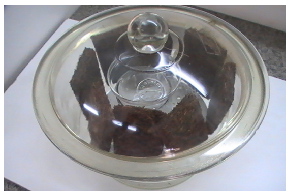
شکل ۱- روش دسیکاتور برای جذب فرمالدهید

میانگین حجم اسید کلریدریک مصرف شده برای دو آزمایش، 17/8 میلی‌لیتر می‌باشد که با قرار دادن این عدد در رابطه (ضمیمه ۱) مقدار C_A برابر 1/0.69 میلی‌گرم بر میلی‌لیتر بدست آمده که اگر این عدد را در رابطه (ضمیمه ۲) قرار دهیم، غلظت محلول استاندارد B برابر 10/69 میکروگرم بر میلی‌لیتر بدست خواهد آمد. با استفاده از این عدد و با توجه به میزان رقت هر یک از لوله‌های ۱ تا ۷، غلظت فرمالدهید در محلول‌های ۱ تا ۷ محاسبه گردید که در جدول ۱ درج گردیده است. جذب نمونه‌های استاندارد (لوله‌های ۱ تا ۷) در جدول ۱ و اعداد جذب نمونه‌های آزمایش در جدول ۲ درج شده است. لازم بذکر است که اعداد جذب هر یک از نمونه‌های استاندارد ۳ بار قرائت شد. همچنین در هر آزمایش سه نمونه تهیه و عدد جذب هر نمونه سه بار بوسیله دستگاه اسپکتروفتومتر قرائت گردید. در محاسبات، مقادیر میانگین جذب، مورد استفاده قرار گرفت.