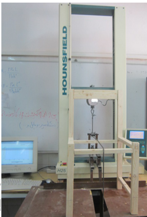
شکل 3 روش بارگذاری دستگاه و ثبت حداکثر نیروی اعمال شده بر روی صندلی‌ها

دستگاه اعمال می‌شود که صندلی لغزش نداشته باشد و یک تکیه‌گاه بر روی انتهای این سطح و در پشت پایه‌های عقبی صندلی وجود دارد تا از حرکت رو به عقب صندلی جلوگیری کند. بارگذاری از جلو به عقب صندلی توسط یک تسمه فلزی اعمال می‌شود. تسمه فلزی به سطح زیر