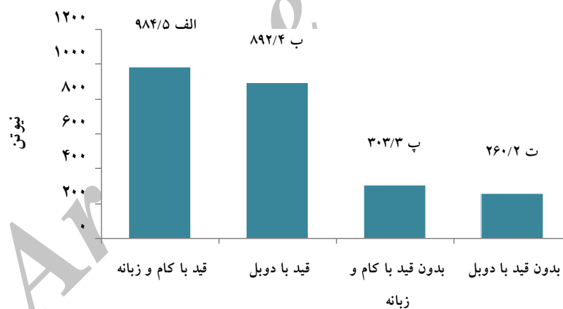
شکل 4 نتایج آزمون دانکن مقایسه میانگین‌ها

نتایج مقایسه میانگین‌های اثرات متقابل براساس آزمون مقایسه میانگین دانکن بشرح شکل 4 می‌باشد.