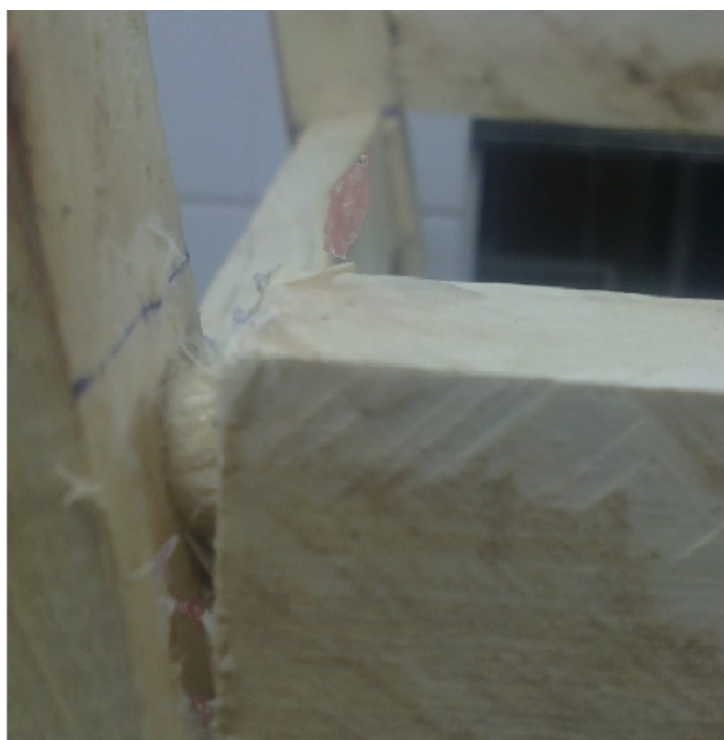
شکل 5 شکست صندلی پس از بارگذاری در محل اتصال پایه‌های عقبی صندلی

نشان می‌دهد که تیمارها و اثرات متقابل آنها معنی‌دار می‌باشد.