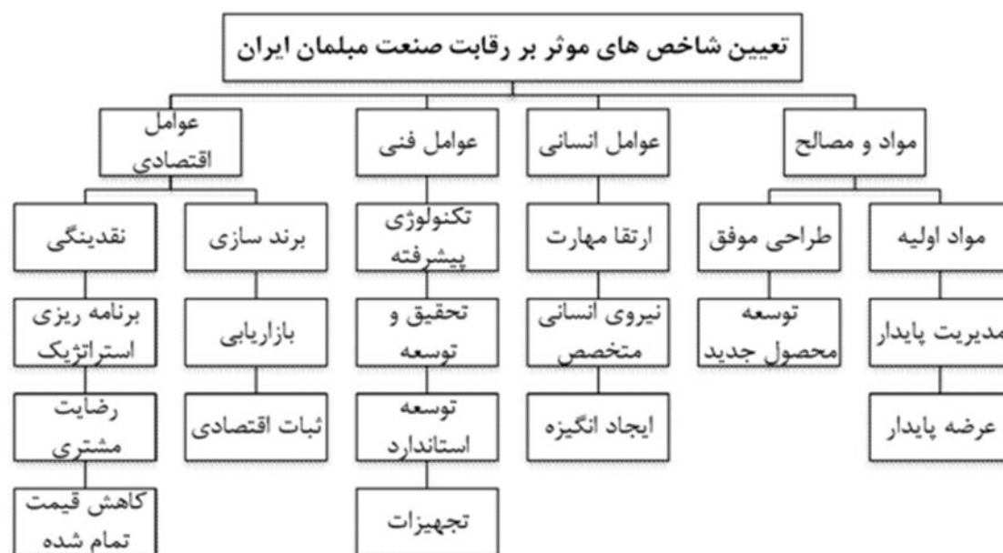
شکل ۱- شاخص‌ها و زیر شاخص‌های مؤثر بر رقابت‌پذیری صنعت مبلمان چوبی در ایران

توضیح شاخص‌های مؤثر در این قسمت ارائه می‌گردد: