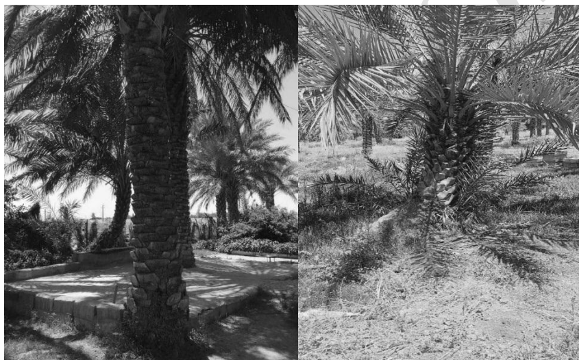
شکل ۱- دو نوع نخل مورد مطالعه (خاصی سمت چپ، حاج محمدی سمت راست)

طی آزمون خمش استاتیک، مقادیر مدول الاستیسیته استاتیک با فرمول ۴ اصلاح و دوباره محاسبه شدند. از سویی برای کمک به تفسیر نتایج، کارایی تبدیل آکوستیک و تانژانت دلتا طبق فرمول ۵ و ۶ اندازه گیری گردیدند (Roohnia, 2016; Madhoushi & Daneshvar, 2014; ASTM, 2012; Tranishi et al., 2008). برای محاسبه مدول برشی نمونه ها به روش تقریب، از رابطه ۷ استفاده شد (Ebrahimi, 2013).