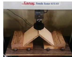
الف- آزمون کششی

شکل ۲- تکیه گاه برای قرارگیری نمونه های آزمون اتصال (L شکل)، در دستگاه Tensil Tester